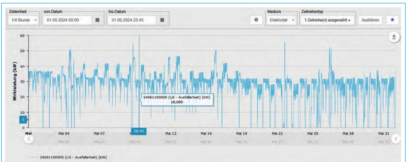
Abb. 3 Die im AKTIF-System erfassten Ausfallarbeitszeitreihen, die mit den vom Netzbetreiber gemeldeten Daten abgeglichen werden, dienen als Grundlage der weiteren Verrechnung

Wie die Praxis zeigt, haben Netzbetreiber hier eindeutige Vorstellungen, die zum Teil weit ins Detail gehen. Solide aufgestellt ist man als BKV in der Regel, wenn die bilanzkreisscharfe, monatliche Abrechnung fol-